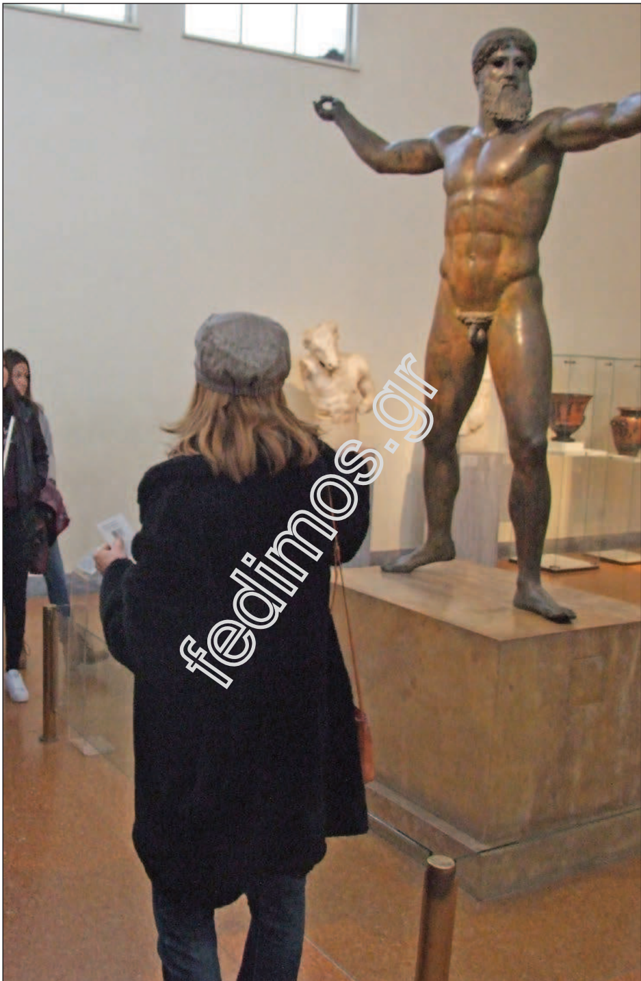
Εθνικό Αρχαιολογικό Μουσείο Ελλάδας.