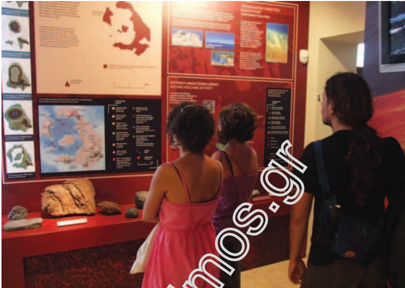
Ηφαιστειολογικό Μουσείο, Νικιά Νισύρου.

και πολιτισμικά χαρακτηριστικά μπορεί να ειδικευτεί στην ανάπτυξη της μορφής του τουρισμού που ανταποκρίνεται σ' αυτά με σεβασμό πάντοτε στην τοπική παράδοση και με γνώμονα την προστασία του φυσικού περιβάλλοντος. Καθώς η Ελλάδα συνδυάζει το ορεινό τοπίο με το θαλάσσιο τοπίο προσφέρεται για την ανάπτυξη διαφορετικών μορφών τουρισμού με εστίαση στην ιδιαιτερότητα της κάθε περιοχής.