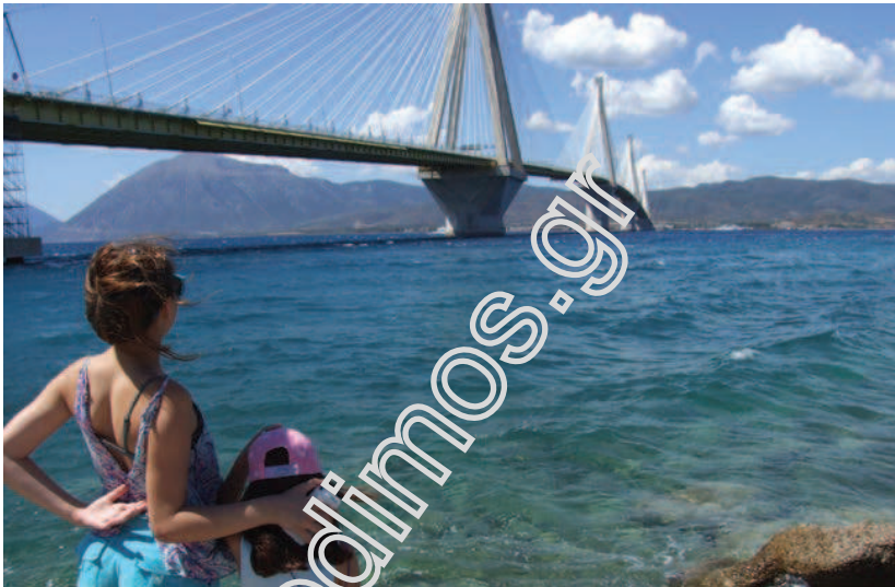
Η γέφυρα Ρίου-Αντιρρίου.

• Ιονία οδός (Α5). Ο αυτοκινητόδρομος έχει μήκος 196 χλμ. και αποτελεί τμήμα της Ευρωπαϊκής Οδού 55 (Ε55) από το Αντίρριο μέχρι και τον Α/Κ Αμβρακίας. Από εκεί έως τη σύνδεσή του με την Εγνατία οδό, αποτελεί την Ευρωπαϊκή οδό 951 (Ε951). Διασχίζει τις περιφερειακές ενότητες Αχαΐας, Αιτωλοακαρνανίας, Άρτας, Πρέβεζας και Ιωαννίνων.