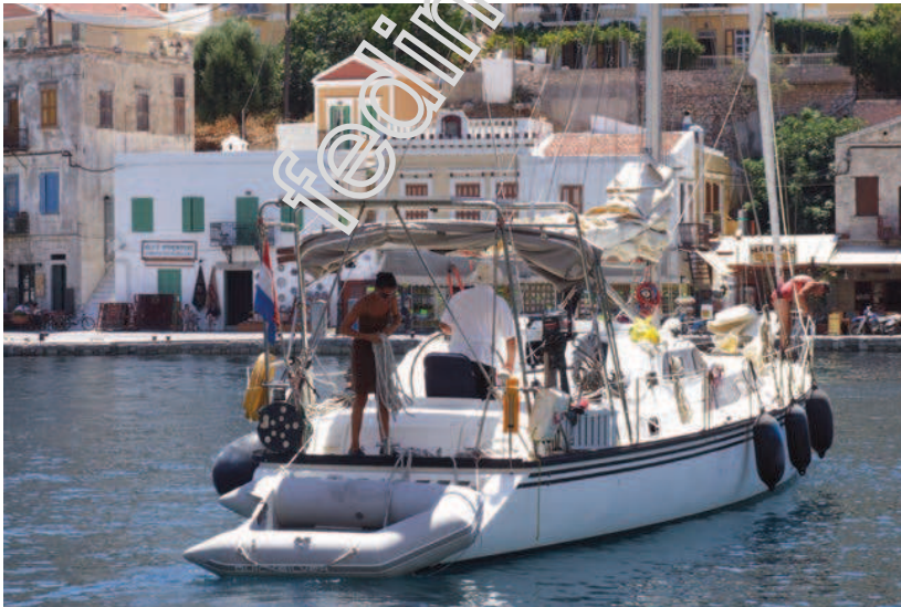
Ιστιοπλοϊκό στο λιμάνι της Σύμης.

Το ακτοπλοϊκό δίκτυο της χώρας είναι εκτεταμένο. Πλήθος ακτοπλοϊκών δρομολογίων συνδέει την ηπειρωτική χώρα με τη νησιωτική. Στο Αιγαίο πέλαγος κόμβος των ακτοπλοϊκών συγκοινωνιών είναι το λιμάνι του Πειραιά. Από το λιμάνι του Πειραιά απλώνεται ένα ευρύ ακτοπλοϊκό δίκτυο προς τα νησιά του Αιγαίου, τις Κυκλάδες, τα Δωδεκάνησα και την Κρήτη. Επίσης την ακτοπλοϊκή σύνδεση με τη νησιωτική Ελλάδα του Αιγαίου συνεπικουρούν τα λιμάνια της Ξαφήνας και του Λαυρίου.