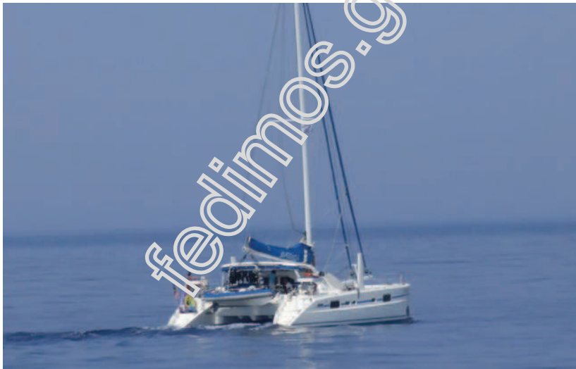
Ιστιοπλοϊκό σκάφος στο Αιγαίο.

Η θάλασσα αποτελεί σπουδαίο φυσικό πόρο για τη χώρα. Επίσης η εκτεταμένη παράκτια ηπειρωτική και νησιωτική ακτογραμμή αποτελεί τη βάση ανάπτυξης διαφόρων θαλάσσιων δραστηριοτήτων αναψυχής.