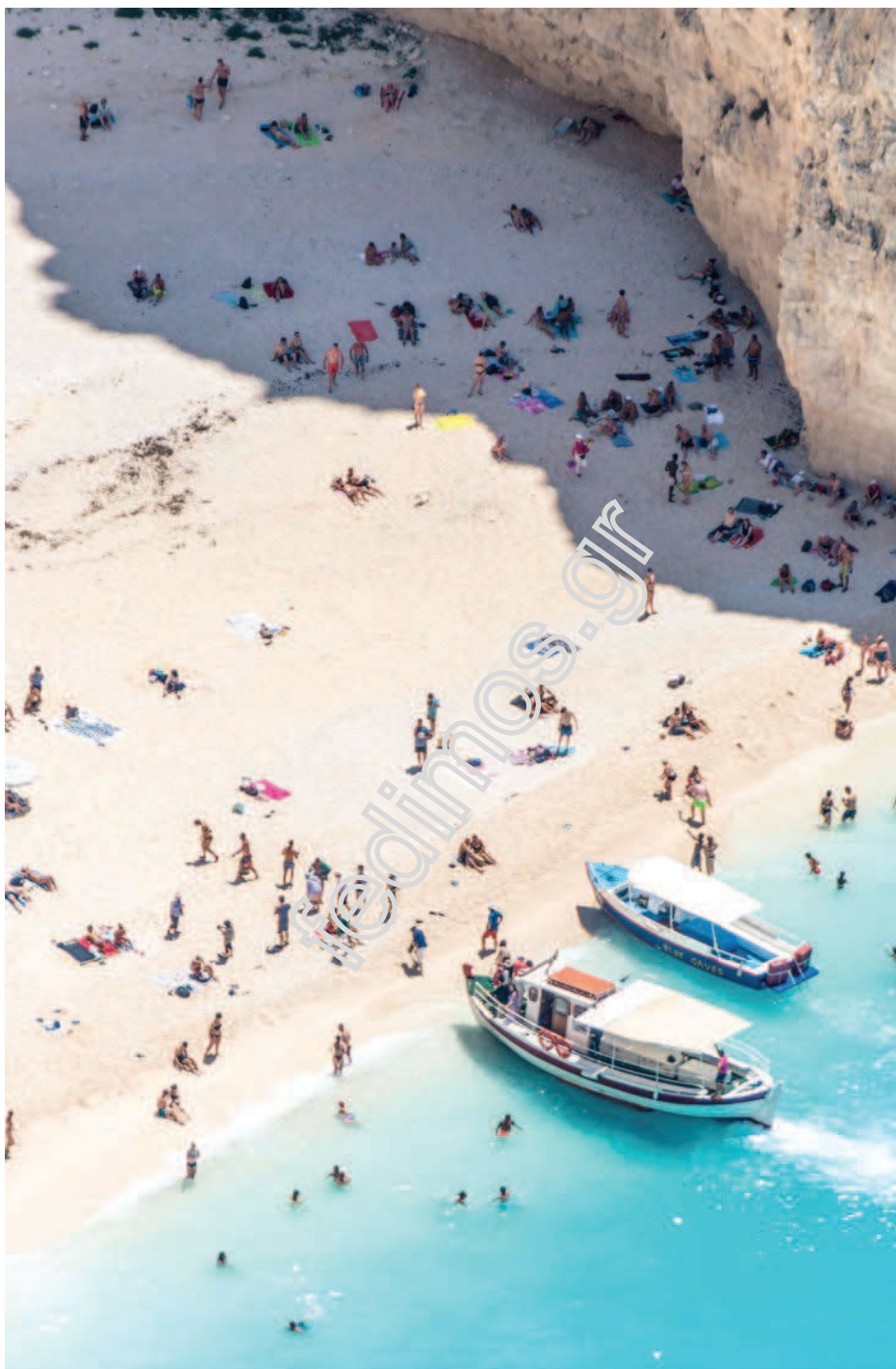
Η παραλία της Ζακύνθου, Ναυάγιο.