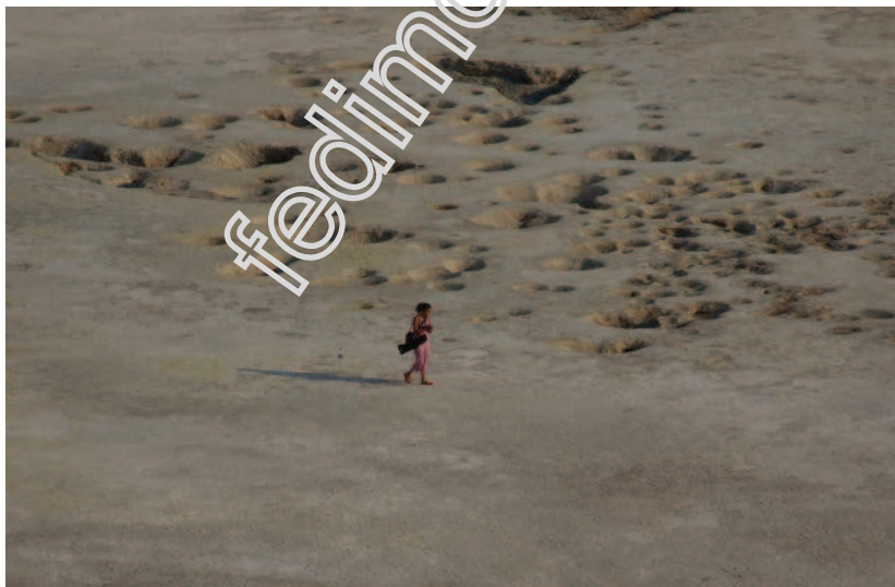
Το Ηφαίστειο της Νισύρου.

Το νομικό πλαίσιο προστασίας των πιο πάνω αναφερόμενων περιοχών θέτει τις προϋποθέσεις για την ανάπτυξη του οικοτουρισμού στην Ελλάδα.