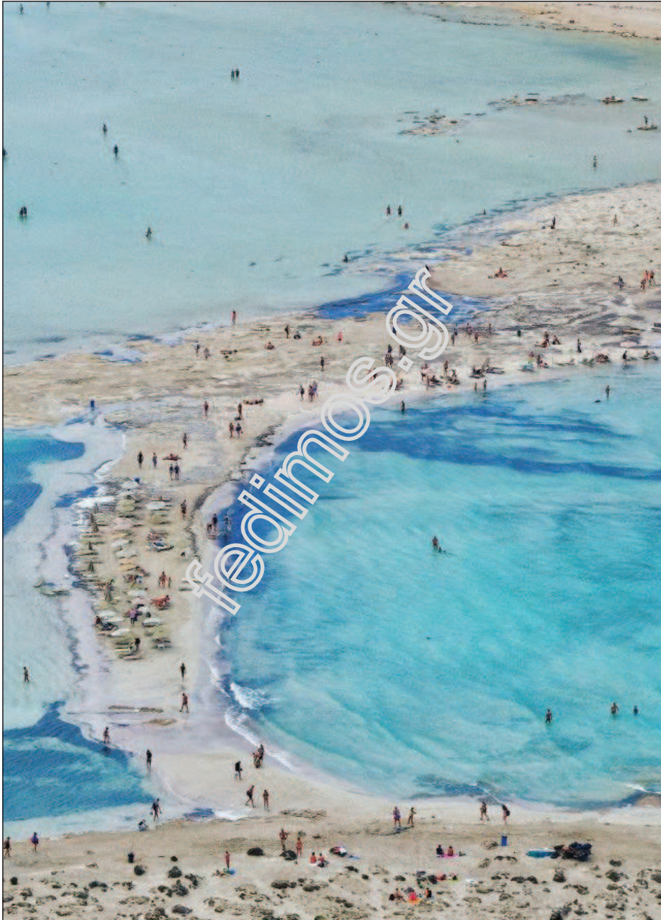
Κρήτη. Η λιμνοθάλασσα του Μπάλου.

(Βέρμιο, Πιέρια, Όλυμπος, Όσσα, Μαυροβούνιο, Πήλιο) έχουν κατεύθυνση από βορρά προς νότο. Στις οροσειρές αυτές οι ανατολικές πλαγιές επειδή δέχονται περισσότερες βροχές είναι πλουσιότερες σε βλάστηση.