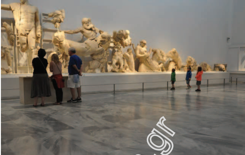
Αρχαιολογικό Μουσείο Ολυμπίας.

και την τοπική παράδοση (οινοτουρισμός – γαστρονομικός τουρισμός), τα διάφορα φεστιβάλ και τις εκδηλώσεις και γενικότερα την κοινωνική, οικονομική και πολιτική δομή.