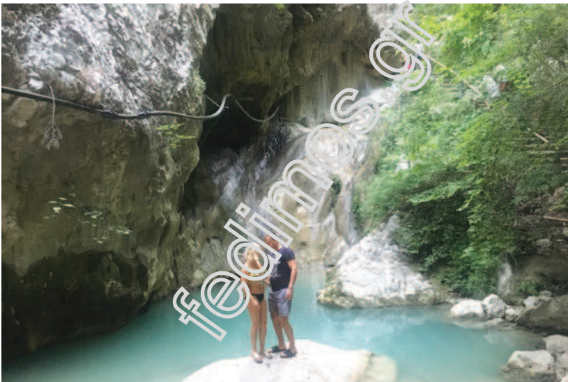
Οι καταρράκτες στο φαράγγι Δημοσάρι, Νυδρί Λευκάδας.

Ο οικοτουρισμός είναι ένα ταξίδι υπεύθυνο περιβαλλοντικά, σε σχετικά άθικτες φυσικές περιοχές με στόχο την απόλαυση της φύσης, που παράλληλα προωθεί την προστασία αυτής και ελαχιστοποιεί τις αρνητικές επιδράσεις των επισκεπτών στο περιβάλλον. Ο Οικοτουρισμός είναι το ταξίδι στη φύση που συμβάλλει στην προστασία του περιβάλλοντος και στην αιεφόρο ανάπτυξη 17 .