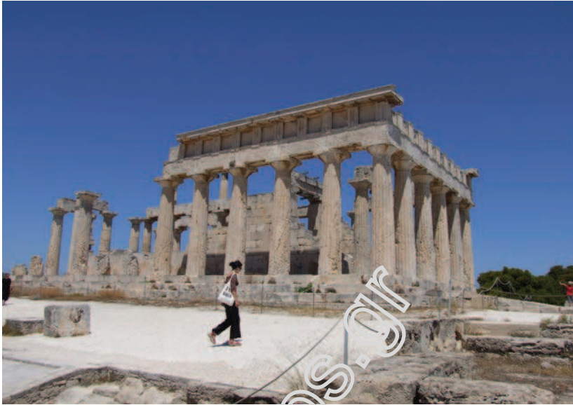
Αίγινα, ναός της Αφαίας.

κρατορίας που δημιούργησε διανεμήθηκαν μεταξύ των στρατηγών του και δημιουργήθηκαν νέα βασίλεια που κυριάρχησαν κατά τους ελληνιστικούς χρόνους (3ος–1ος αι. π.Χ.).