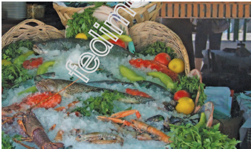
Ψάρια και θαλασσινά, πρώτες επιλογές της ελληνικής γαστρονομίας.

Η γαστρονομία καθίσταται το κύριο κίνητρο επιλογής ενός τουριστικού προορισμού ή τουλάχιστον ένα από τα σημαντικότερα. Μπορεί μάλιστα να θεωρηθεί η γαστρονομία ως υποκατηγορία του πολιτισμικού τουρισμού. Σύμφωνα με την World Food Travel Association, ο γαστρονομικός τουρισμός αναφέρεται στην αναζήτηση ιδιαίτερων ή μοναδικών εμπειριών φαγητού και ποτού 11 . Η γαστρονομία πέρα από το καλό φαγητό, δημιουργεί ένα πλήρες δίκτυο δραστηριοτήτων που αφορά το φαγητό και την διατροφή. Περιλαμβάνει την προμήθεια των διαφόρων υλικών-προϊόντων συστατικών του φαγητού, την προετοιμασία, την παρασκευή του φαγητού, την παρουσίαση, τους τρόπους κατανάλωσης, το κοινωνικό πλαίσιο κατανάλωσης του φαγητού, αλλά και τους συμβολισμούς της κατανάλωσής του 12 .