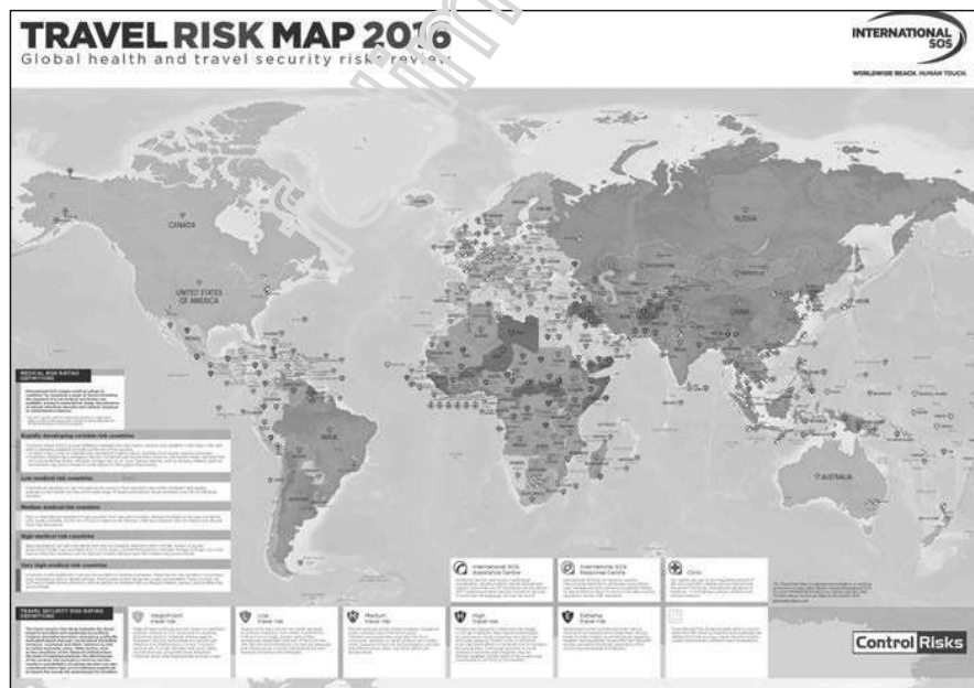
Εικόνα 1.2. Χάρτης επικινδυνότητας τουριστικών προορισμών 2016

Το κυβερνητικό ενδιαφέρον εκδηλώνεται με πολλούς τρόπους. Η Γερουσία των Ηνωμένων Πολιτειών ίδρυσε, για πρώτη φορά στην ιστορία του Κογκρέ-