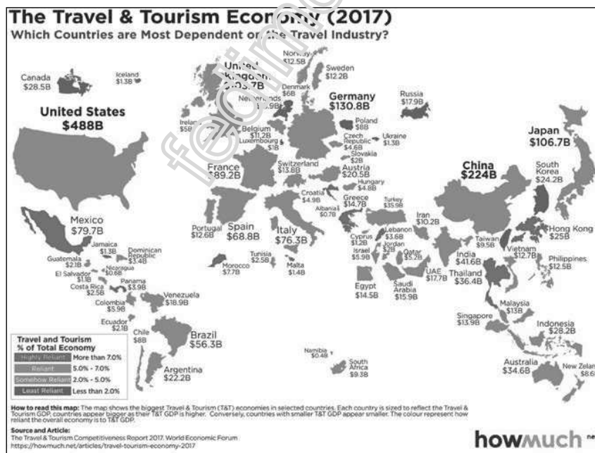
Εικόνα 1.1. Ο παγκόσμιος χάρτης τουριστικής ανάπτυξης

Σύμφωνα με τον χάρτη της Εικόνας 1.1 οι χώρες κατατάσσονται ανάλογα με το ποσοστό του ΑΕΠ που καλύπτει ο τουριστικός κλάδος. Οι πλέον αναπτυγμέ-